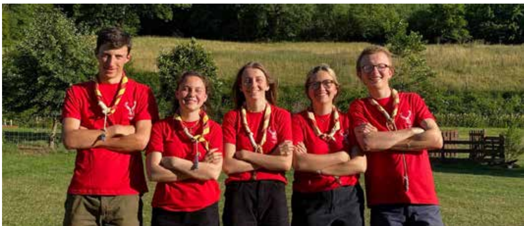
Votre staff : Akéla, Rikki, Chikaiï, Tegumaiï, Baloo et Bagheera

Merci à tous pour ce camp qui fût une énorme réussite ! Merci également aux parents pour leur soutien, leur présence, leurs idées, leur engagement vis-à-vis du scoutisme et de la meute. Nous vous disons « à l'année prochaine » !