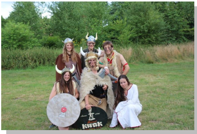
Le staff 2014-2015

Merci à toutes pour cette année de dingue ainsi que pour ce camp !